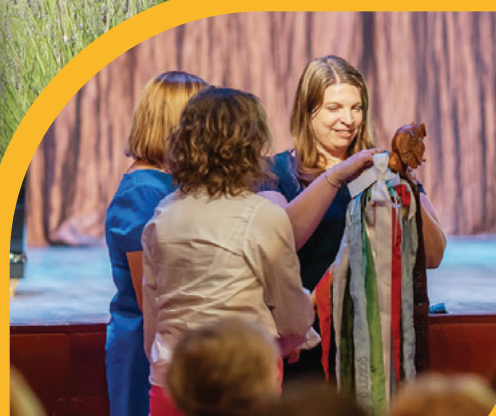
MEGYEI KÖNYVTÁROS- TALÁLKOZÓ