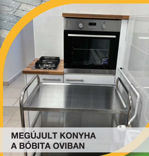
MEGÚJULT KONYHA A BÓBITA OVIBAN