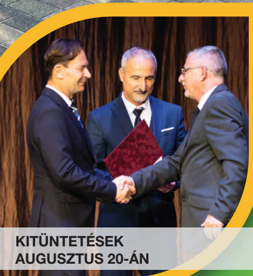
KITÜNTETÉSEK AUGUSZTUS 20-ÁN