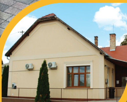
5 MILLIÁRD FORINTNYI FEJLESZTÉS 2019 ÓTA