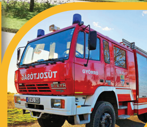
ÚJ TŰZOLTÓAUTÓ GYÖMRŐN