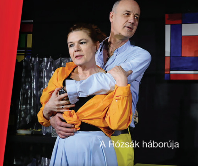
A Rózsák háborúja