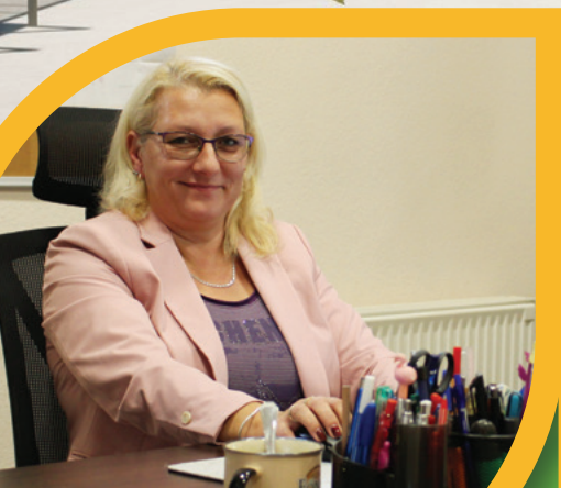
INTERJÚ A KHT VEZETŐJÉVEL