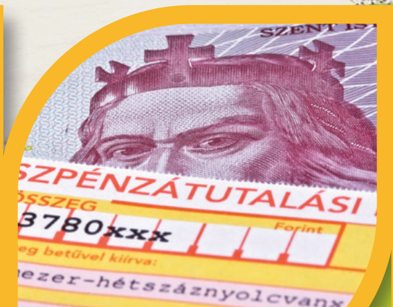
CSÖKKENŐ VÁROSI REZSIKÖLTSÉGEK