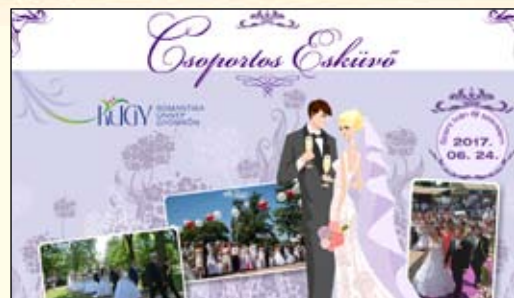
Csoportos esküvők – 9. oldal