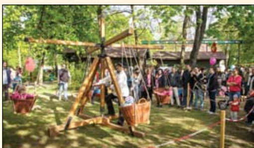
Nyuszibuli beszámoló – 7. oldal