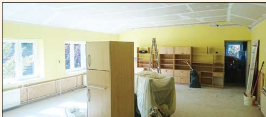
Az Arany Óvoda tetőtéri csoportszobáira fért rá leginkább a felújítás. Ennél a két csoportnál a vizesblokk is átépült.

A hamarosan mögöttünk álló nyár pedig az oktatási intézmé- nyek fejlesztéséről szól. Rengeteg helyszínen, óvodákban, iskolákban