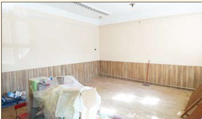
A Bóbita Óvodában a növekvő gyermeklétszám miatt kialakítottunk egy új csoportszobát.