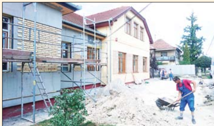
Épül és szeptember elejére kész a Csokonai Iskola épülete. A teljes felújításnál külön figyelmet fordítottunk arra, hogy megőrizzük az épület eredeti jellegét. Itt térkövezett parkoló is épült.

indult el szinte egyszerre a munka. Számomra a legfontosabbak mindig az oktatási és gyermek intézmények voltak. Annak ellenére, hogy az iskolák idén január óta már az államhoz tartoznak, mégsem engedték el a kezüket. Azt valom, hogy függetlenül attól, ki üzemelteti az iskolát, ha oda gyömrői gyermekek járnak, akkor erőnkhez mérten, de gondoskodnunk kell az intézményről. Nemcsak a közelmúltban elnyert negyedmilliárdnyi pályázati pénzből, de saját forrásainkból is fejlesztettük városunk iskoláit. Az óvodáknál komoly kihívást jelent, hogy új csoportokat kell indítanunk a folyamatosan növekvő gyermeklétszám miatt. Igyekezünk a rendelkezésre álló pénzeket úgy elosztani, hogy ott fejlesszünk, ahol a legszükségesebb. A kivitelezési munkákba minél több