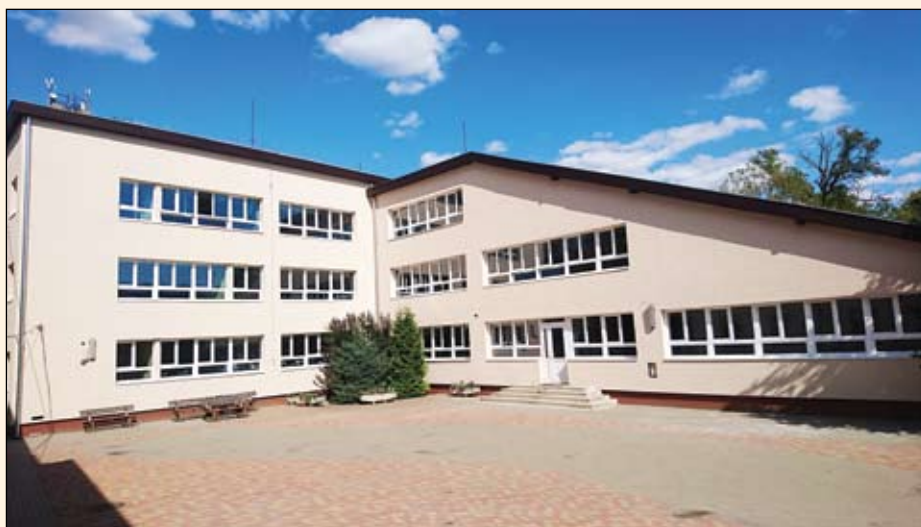
Elkészült a Weöres Sándor Általános Iskola teljes felújítása. Új külső, új nyílászárók. Megújult két tetőtéri tanterem és a tankerület által az összes vizesblokk.