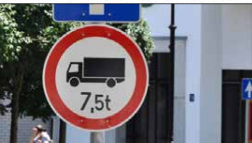
Változások a közlekedésben Gyömrőn – 4. oldal