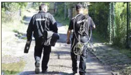
Tájékoztatás kéményseprésről – 5. oldal