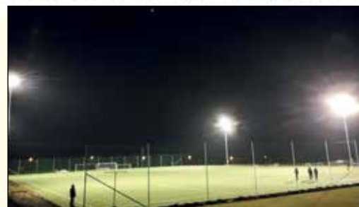
Futballpálya fejlesztések – 15. oldal