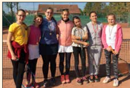
Nagy pályások balról jobbra:

Büszke vagyok mind a két csapatomra. Voltak vereségek és szép győzelmek is, de ami a leginkább tetszett, hogy