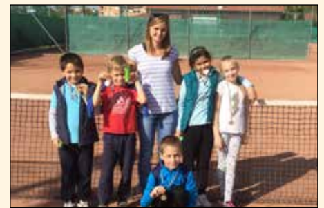
Piros pályások balról jobbra: