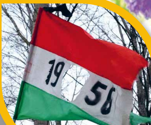
'56-os emlékmű készül városunkban