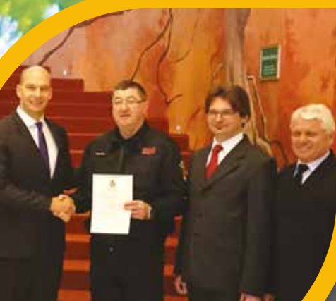
Önálló beavatkozási jog tűzoltóinknak