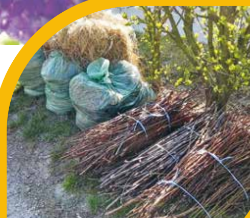
Változik a zöldhulladék elszállítása