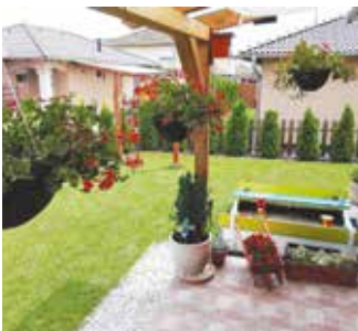
Aranyi László kertje