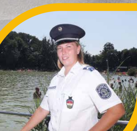
Életet mentett a rendőrájárőr a Tófürdőn