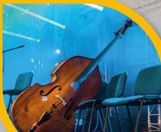
Óriási siker az első Zenei Fesztivál