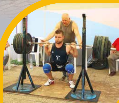
Súlyemelő szakosztály indult Gyömrőn