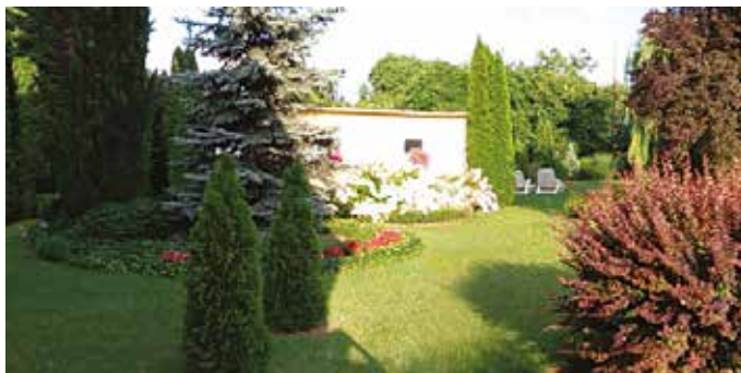
Szilágyi Árpád kertje