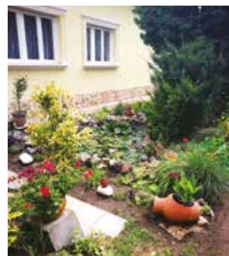
Pocsai Renáta kertje