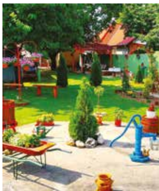
Györffy Imre kertje