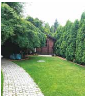
Gabler Melinda – Árpád utcai kertje