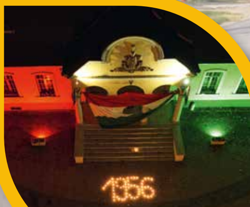
Új '56-os emlékmű városunkban