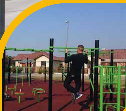
Elkészült az új kondipark

Mennyiségi növekedés helyett minőségi fejlődésre van szükség