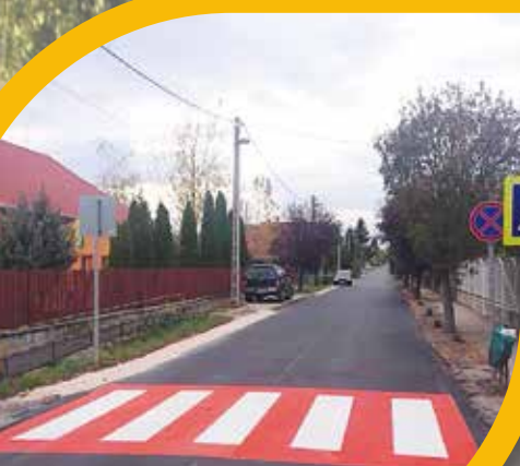
Megújult utak a városban