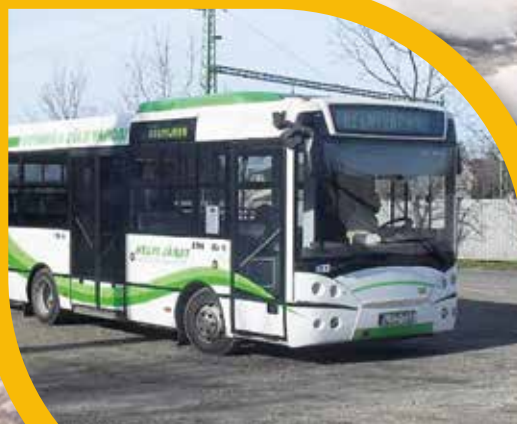
Megújulhat a helyi buszközlekedés