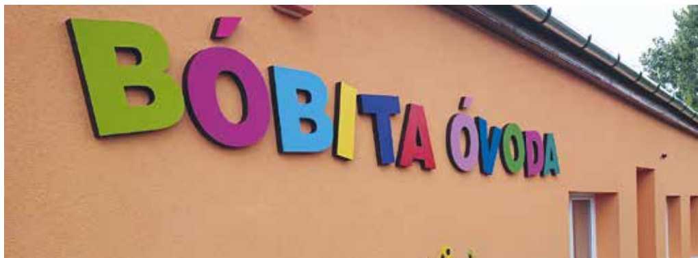
Idén is folytatódnak az óvodafelújítások