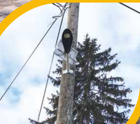
Külterületeinken is legyen világosság!