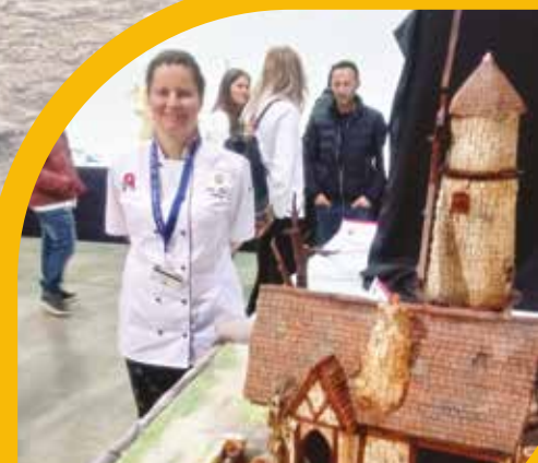
Gyömrői cukrász a világ legjobbjja