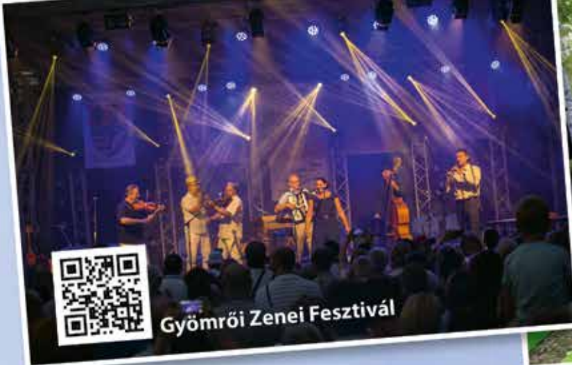
Gyömrői Zenei Fesztivál