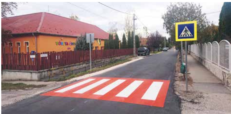
Biztonság gyalogátkelőhelyek a gyermekintézményeknél

dést kialakítani az oktatási feladatokat ellátó tankerülettel. Közös dolgoztuk ki a város oktatásfejlesztésének koncepcióját, én pedig kapcsolataimmal és az önkormányzat eszközeivel segíteni fogom az új beruházások megvalósulását. Kedves szülők! Megígérhetem, hogy kiemelt figyelmet fogunk fordítani az iskolai fejlesztésekre, és minden eszközömmel segítem és támogatom az állami beruházások mielőbbi megvalósulását. Ez mindnyájunk közös célja.