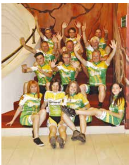
Fő a vidámság