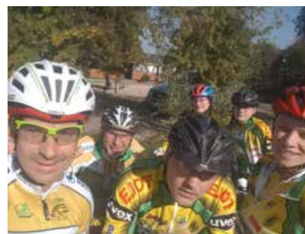
Vidám edzés, még az elején