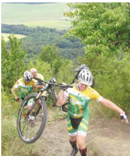
Nagyon nehéz ez a bringa – Szanda csúcstámadás