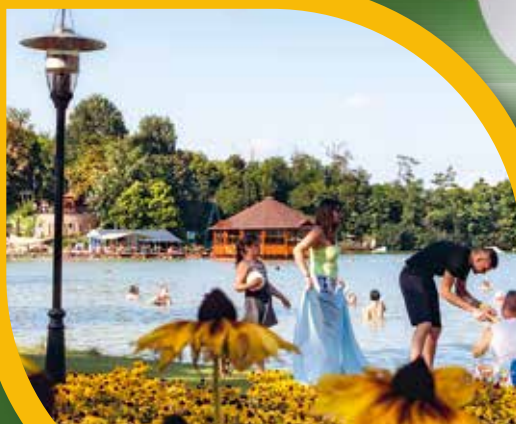
Eredményesen zártuk a strandszezont