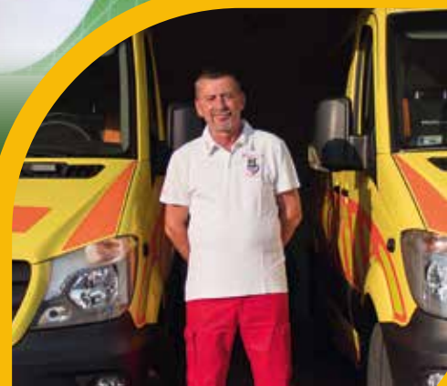
Jubilált a mentőállomás vezetője

Csekkautomatát telepít az önkormányzat a városközpontba