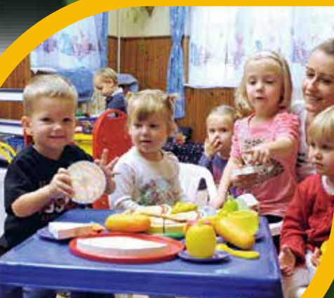
Bölcsőde bővítésre pályázunk