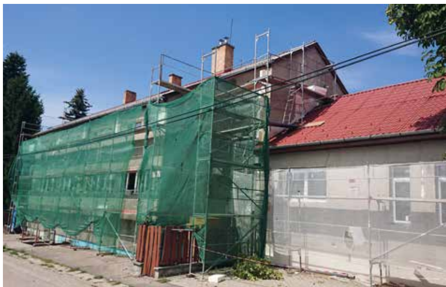
Felújítjuk a Pázmány utcai óvodát

Hiszen közeledik a szeptember, és akinek ovis gyermeke van, joggal várhatja, hogy csemetéje méltó körülmények között kezdhesse meg óvodás munkaviszonyát, hogy csak egy területet említsek a sok közül. Az első komoly téma ezért, amiről írnék, az a teher, amely az ugrásszerűen megnövekedett lakosságszámból hárult ránk hirtelen. Az elmúlt egy-két év építőipari robbanása olyan mennyiségű új lakást eredményezett, aminek hatására rengeteg új család költözött városunkba. Ennek egy-