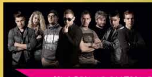
CHILDREN OF DISTANCE