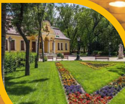
Újra sínen a zöldfelületek gondozása