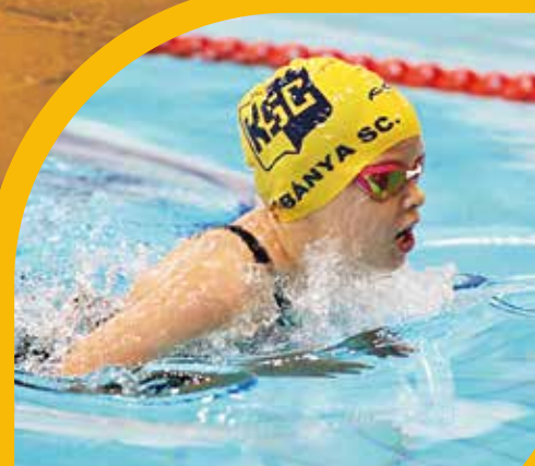
Kilenc éves gyömrői úszóbajnok