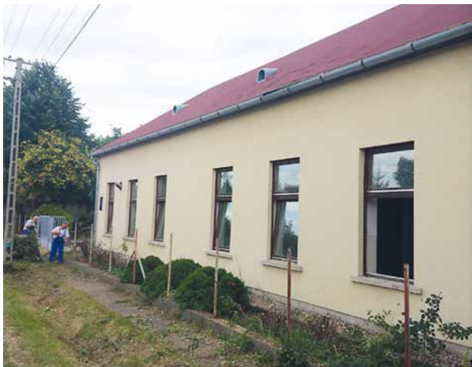
Készül a Deák utcai óvoda