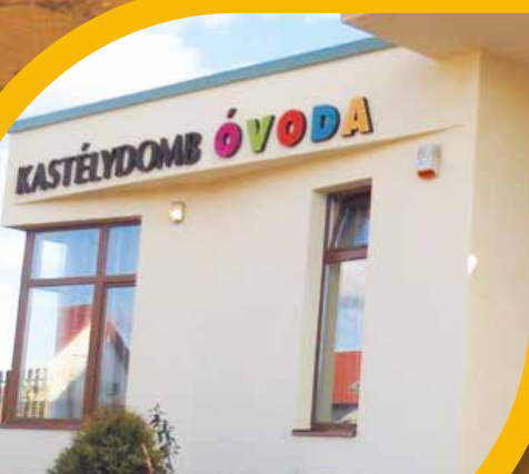
Szeptembertől nő az óvodai férőhelyek száma