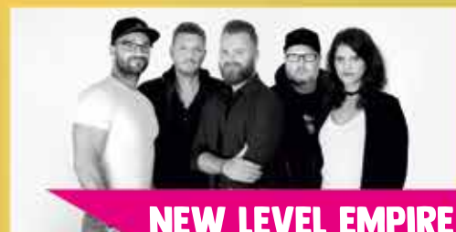
NEW LEVEL EMPIRE