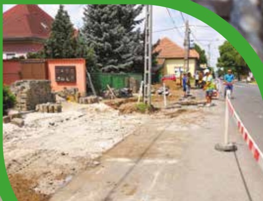
ÚJ PARKOLÓK ÉPÜLNEK A TÁNCICS ÚTON