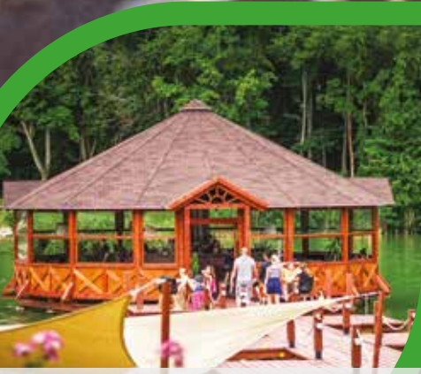
IDÉN ISMÉT KOKTÉLOZHATUNK A TÓ KÖZEPÉN

Mintegy 150 millió forintot nyertünk állami forrásból két legforgalmasabb utcánk átépítésére