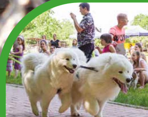
KUTYÁS GAZDIK SPORTOLTAK A TÓZEGES TÓ PARTJÁN