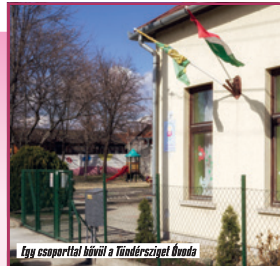
Egy csoporttal bővül a Tündérsziget Óvoda

gyermeket kell felvenni az intéz- ménybe. Szinte még semmilyen hírt nem adtunk az új oviról, mégis már most nagyon sok szülő érdeklődött arról, hogyan kerülhet majd be cse- metéje ebbe az intézménybe. Nos, erről beszélni még korai, de jövő szeptemberig minden tájékoztatást megadunk. A református ovi, amely négy csoporttal működik majd, a Li- get lakóparkban, a Rózsa utcai önkormányzati telken fog