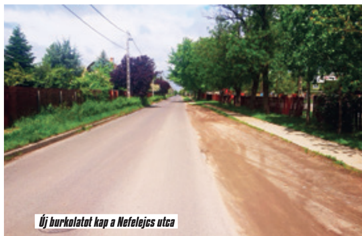
Új burkolatot kap a Nefelejcs utca