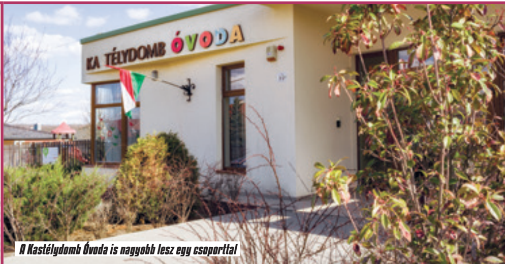
A Kastélydomb Óvoda is nagyobb lesz egy csoporttal

Az egyik a tavaly átadott Tündérsziget óvodában, a másik a Kastélydomb Óvodához épülő új épületszárnyban. Ez ötvennel több óvis felvételét teszi majd lehetővé idén szeptembertől. Városunk saját költségvetéséből alakítjuk ki a két új csoportot. Csak bízni tudunk abban, hogy lesz jelentkező is a meghirdetett állásokra, hi-