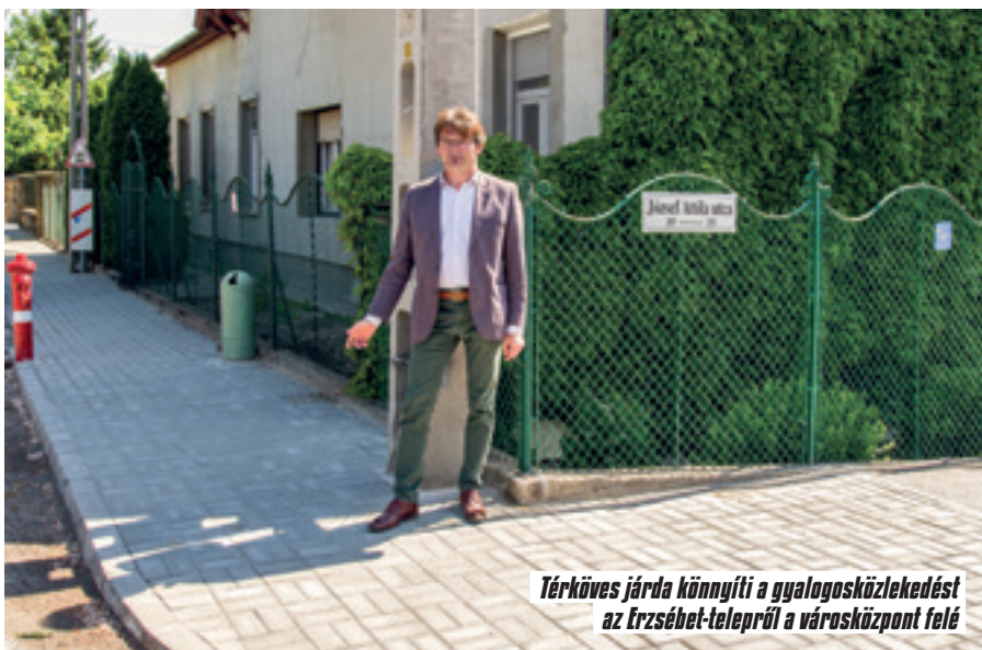
Térköves járda könnyíti a gyalogosközlekedést az Erzsébet-telepről a városközpont felé

Elkészült a Szent István úti járda felújított szakasza a Felvidéki utcától a Teleki László Gimnáziumig. A mintegy 250 méteres szakaszon az ELMŰ által kicserélt új villanyoszlopok 5 méteres körzetében az ELMŰ, a közöttük lévő területeken az önkormányzat finanszírozásában készült el térkőburkolattal teljes szélességében a gyalogjárda.