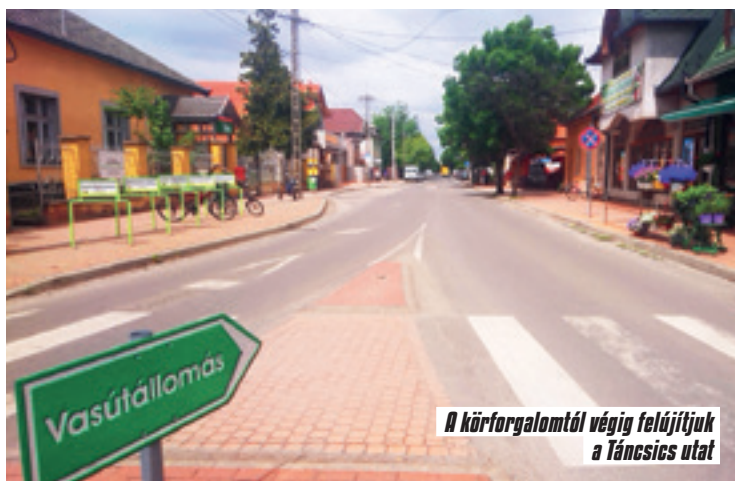
A körforgalomtól végig felújítjuk a Táncsics utat

A Nefelejcs utca is új burkolatot kap. Itt az árkok kialakításával kell majd kezdeni a munkát, mivel nagyon sok helyen okoz gondot a vízelvezetés hiánya. Itt is épül új gyalogátkelő. Az Eskü tér mellett parkoló és új járdaszakasz épül majd. Ez az út városunk jelenleg legrosszabb állapotban lévő utcája, de már csak egy keveset kell várni, hogy kifogástalan új burkolaton lehessen erre autózni.