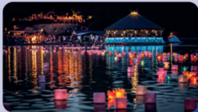
5000 kívánságlámpás úsztatása