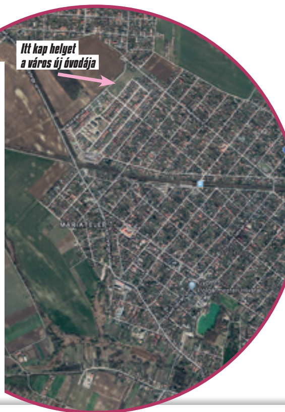
Itt kap helyet a város új óvodája