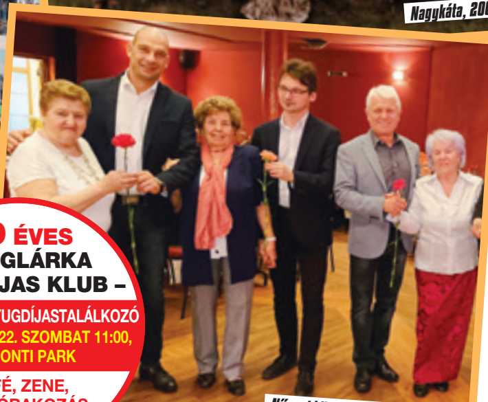
Nőnapi köszöntés Gyömrőn, 2019