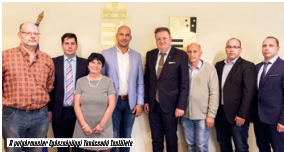
A polgármester Egészségügyi Tanácsadó Testülete

Az ülés az egészségügyi fejlesztések 10 éves távlatáról szólt. A városvezetés célja egy racionális, jól működő egészségügyi ellátás biztosítása, amelynek érdekében a következő célkitűzések fogalmazódtak meg a tanácskozáson: