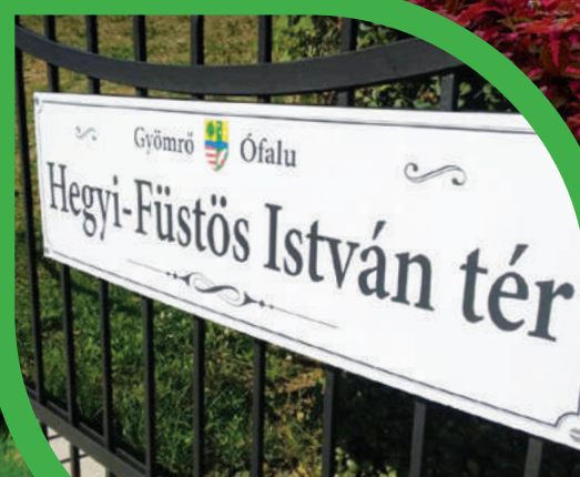
TERET NEVEZTEK EL A NÉHAI LELKIPÁSZTORRÓL