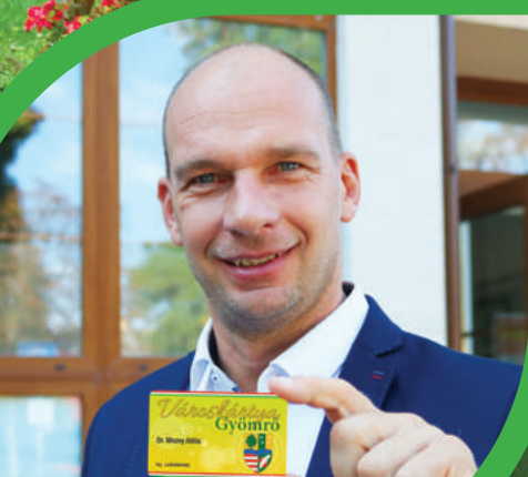
BEVEZETJÜK A GYÖMRŐ-KÁRTYÁT