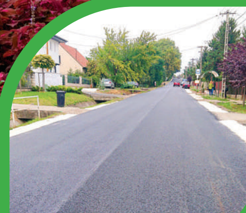
ELKÉSZÜLT A TULIPÁN UTCA FELÚJÍTÁSA