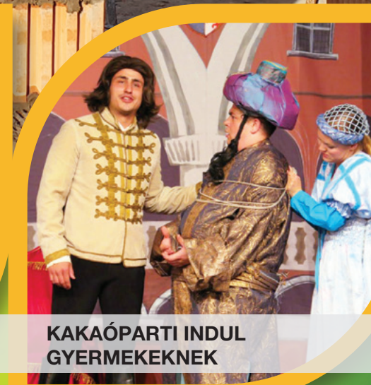
KAKAÓPARTI INDUL GYERMEKEKNEK