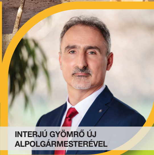
INTERJÚ GYÖMRŐ ÚJ ALPOLGÁRMESTERÉVEL