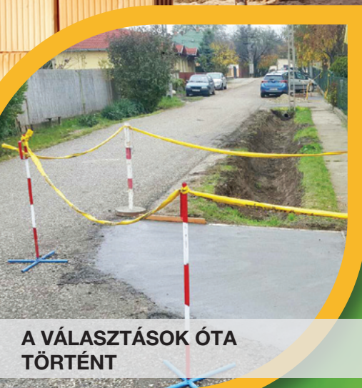
A VÁLASZTÁSOK ÓTA TÖRTÉNT