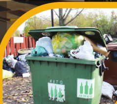
ÜVEGGYŰJTŐ SZIGET ÚJRAGONDOLVA