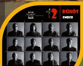
GYÖSZI-PREMIER: 12 DÜHÖS EMBER