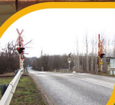
KISZÉLESÍTIK A VASÚTI ÁTKELŐT