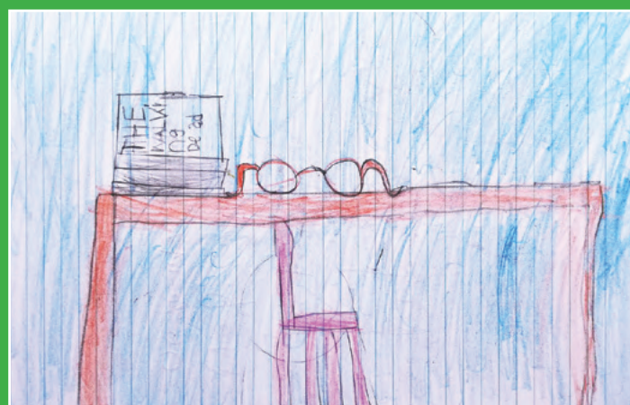
III. helyezett: Suki Rebeka, 8 éves