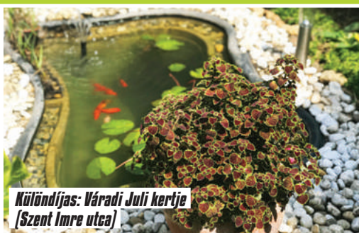
Különdíjas: Váradi Juli kertje (Szent Imre utca)