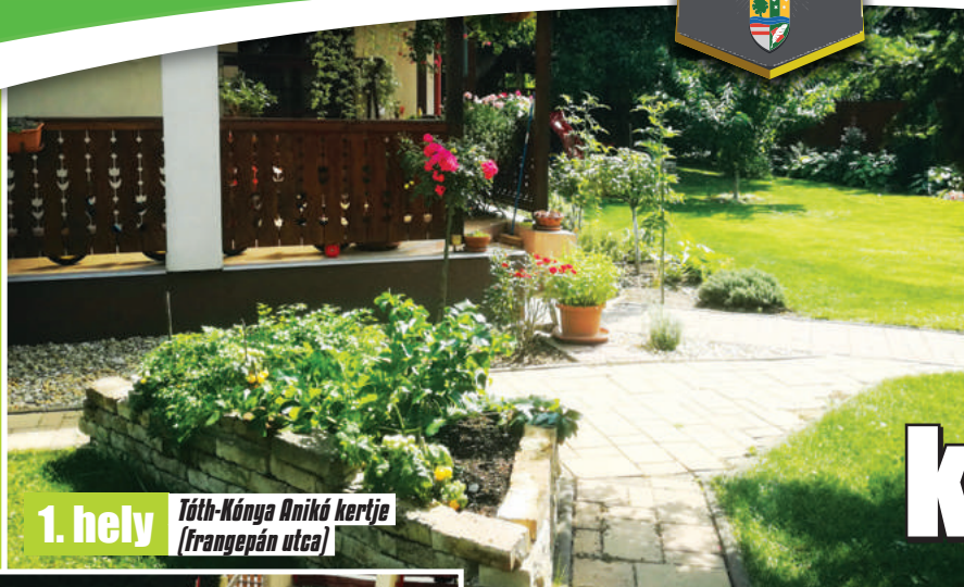
1. hely Tóth-Kónya Anikó kertje (Frangepán utca)