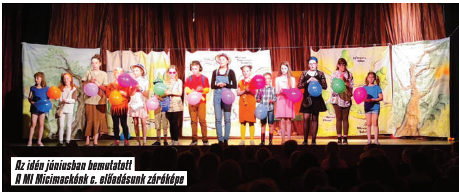
Az idén júniusban bemutatott A MI Micimackónk c. előadásunk záróképe

Emellett kiemelten fontosnak tartják a tehetségek felfedezését és gondozását,