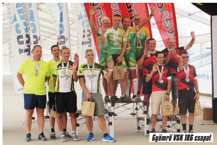
Gyömrő VSK 186 csapat

A csapattagok erőn felül teljesítettek. Az embert próbáló teljesítmény mellett a taktikának is komoly szerepe volt az aranyérem megszerzésében, hiszen a 122 számú csapat