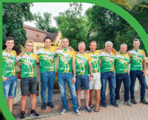
EMBERFELETTI TELJESÍTMÉNY KERÉKPÁROSAINKTÓL