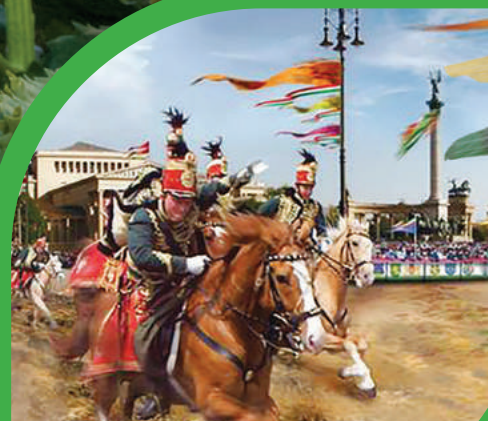
GYÖMRŐ A NEMZETI VÁGTÁN