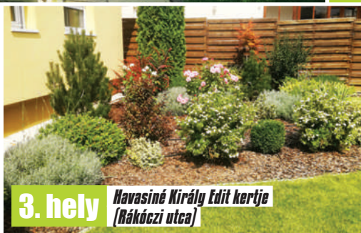
3. hely Navasiné Király Edit kertje (Rákóczi utca)