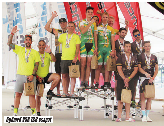
Gyömrő VSK 122 csapat

nagyon szoros küzdelmet vívott az első helyért. Néhány adat mindkét csapat teljesítményéről: A 122 csapat 181 kört, a 186 csapat 187 kört tudott menni a 24 órás verseny alatt. Csapatonként több, mint 800 km-t tekertek összesen a fiúk, egyénileg pedig több, mint 200 km volt mögöttük a végére versenytempóban.