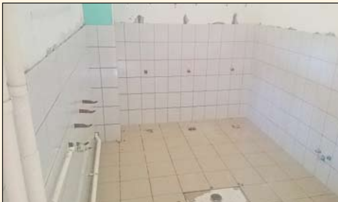
Készül a Bóbita Óvoda vizesblokkja