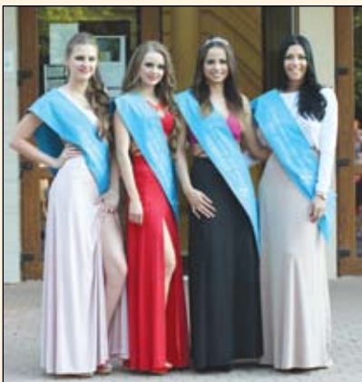
Szépségkirálynő udvarhölgyei kíséretében

A versenyről készült több száz kép megtekinthető a Tószépe facebook oldalán: https://www.facebook.com/gyomro.toszepe , a rendezvényről készült TV felvételt a Williams TV csatornáján sugározzák.