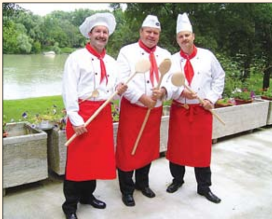
Az éneklő szakácsok