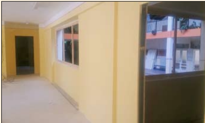
Finisben a tanári felújítása

Jó néhány jelentős fejlesztés valósult meg idén városunkban, és nem maradhattak ki a sorból az oktatási intézmények sem. Számunkra nemcsak programpontok szintjén, hanem a napi feladatok szintjén is kiemelten fontosak a nevelési-oktatási intézmények. Sok település nem engedheti meg magának a nyári felújítások elvégzését, illetve az állami intézményi fenntartást választó önkormányzatok iskoláiban szinte semmilyen felújítás nem történik. Mi azonban szeretnénk odafigyelő, gondos, jó gazdái lenni városunk gyermekintézményeinek. Már az év első felében elkészültek például óvodai csoportszobák burkolatcseréi, amelyeket az intézmény működésének jelentősebb zavarása nélkül is el lehetett végezni. A nagyobb felújításokat azonban a nyári szünidőre terveztük. Így a nyár folyamán