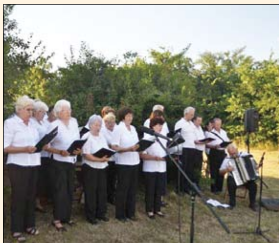
Boglárka Nyugdijas Klub