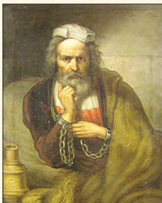
Jakobey Károly festménye Táncsics Mihályról

Táncsics 1884. június 26-án halt meg Budapesten.