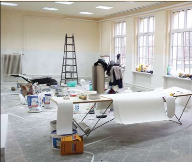
A régi tárgyaló éppen okmányirodává alakul