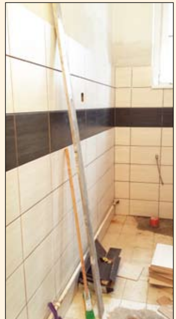
Új csempék a mosdóban