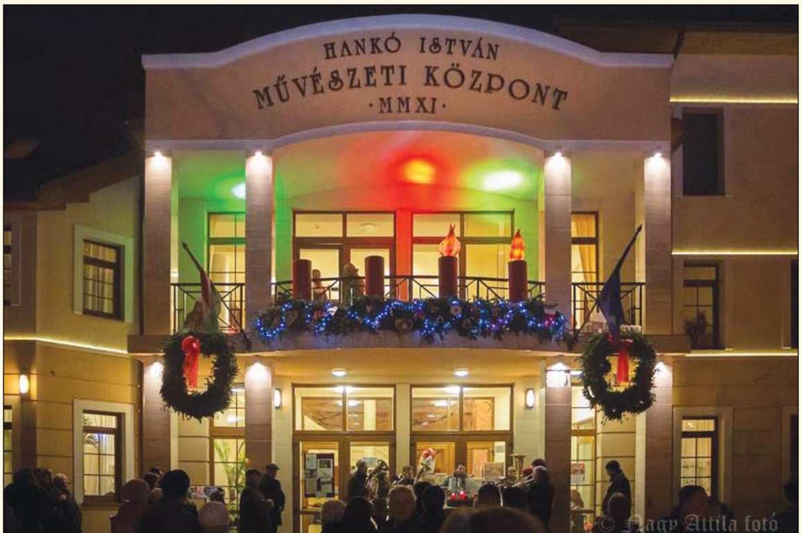
A második gyertyagyújtás